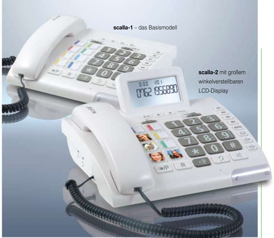
scala-2 mit großem winkelverstellbarem LCD-Display