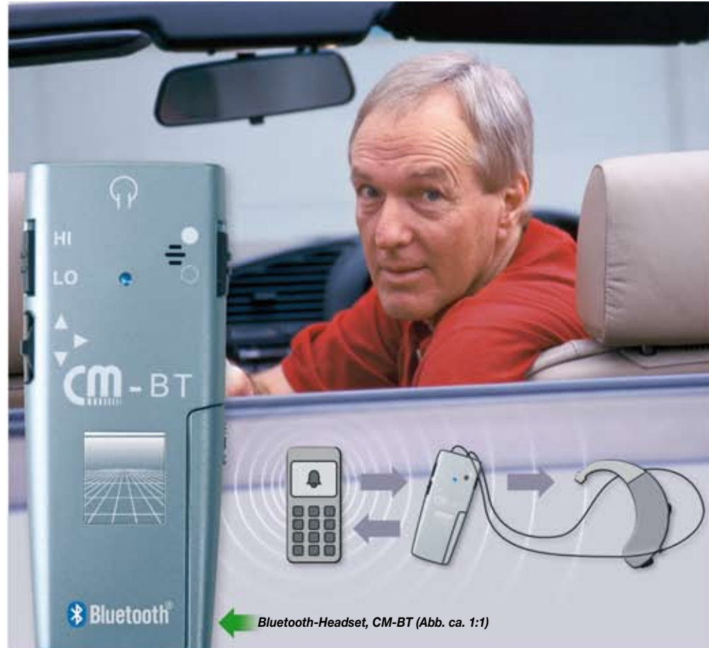
Bluetooth-Headset, CM-BT (Abb. ca. 1:1)

Im Wörth 25 · D-79576 Weil am Rhein Telefon: +49 (0) 7621 / 9 56 89 - 0 Fax: +49 (0) 76 21 / 9 56 89 - 70 Internet: www.humantechnik.com E-Mail: info@humantechnik.com